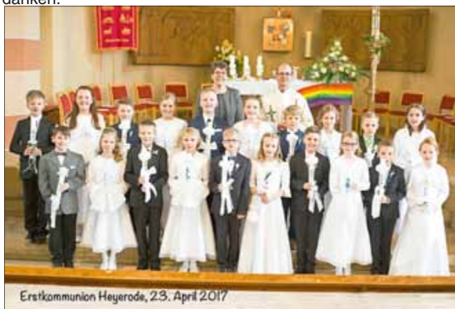
Erstkommunion Heyerode, 23. April 2017

Da wir nun seinen Segen empfangen haben, möchten wir uns von ganzem Herzen bei allen, auch im Namen unserer Eltern, für die vielen Glückwünsche und Geschenke ganz herzlich bedanken.